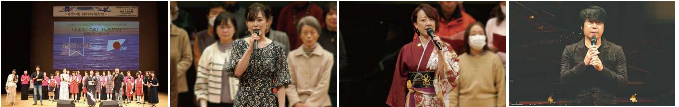
共同ライブコンサートの様子

申込みについて 申込期間: 6/6(木)～7/26(金) 期間中に募集定員に達した場合は申込受付を終了させていただきます。