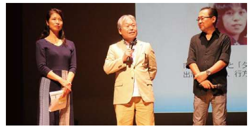
被害者御家族による呼びかけの様子

(※)「特定失踪者」とは、民間団体である「特定失踪者問題調査会」が、「北朝鮮による拉致かもしれない」という御家族の届出等を受けて、独自に調査の対象としている失踪者のこと。